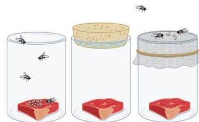
Experimento de Redi.

Francesco Redi, médico e biólogo de Florença, por volta de 1660, foi o primeiro a questionar a teoria da abiogênese. Para isso, realizou um experimento com pedaços de carnes cruas dentro de frascos fechados e abertos. Ele colocou carne no interior de frascos cobertos com gaze e em frascos descobertos. Com o tempo, larvas surgiram no frasco aberto, mas nada aconteceu no frasco fechado. Redi percebeu a visitação de moscas nos frascos abertos, o que sugeria que provavelmente as larvas eram alguma fase de vida desse animal e não que as larvas surgiam a partir da carne. Esse experimento foi, sem dúvidas, um grande avanço para a aceitação da biogênese.